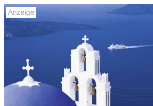
Urlaub Griechenland Angebote