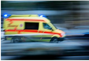
Mutter nimmt Abschied von sterbendem Sohn