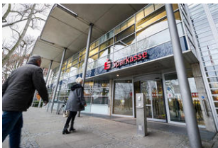
Mutmaßliche Sparkassen-Diebe festgenommen