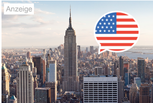
Frische jetzt dein Englisch auf!