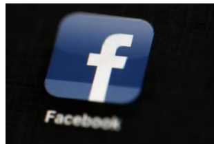
15-Jähriger stellt sich nach Live-Vergewaltigung