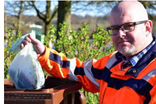
846 braune Tonnen blieben stehen